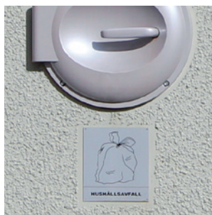
Märk skåpet med aluminiumskylt eller dekal för att underlätta sorteringen.