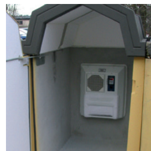
För restauranger kan skåpet erhållas med kylaggregat 230V. Skåpet förses då med dörrtätning och isolerat tak.