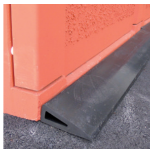
Inkörningsramp av gummi. Art nr 66-1040.

Yttermått: BxDxH 1040x1450x1770 Vikt: 1660 kg