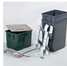
63-6154550 V ägg