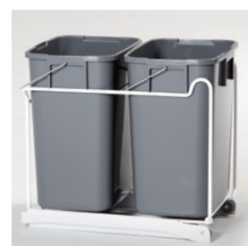
85-81275 Golv Dubbel