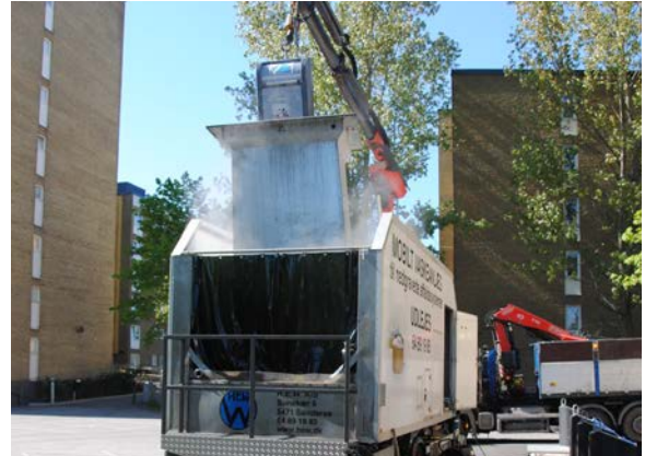
Rengöring av en helt nedgrävd underjordsbehållare

Vid regelbunden tvätt av behållaren behövs endast varmt vatten vid rengöringen - något som är snällt mot miljön.